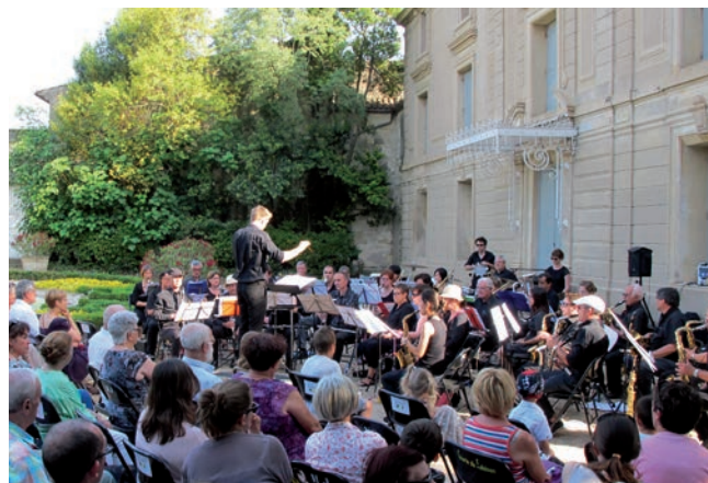
Fête de la musique sur la terrasse d'honneur du château de Bocaud, samedi 21 juin 2014

Elagage, abattage, débroussaillage, entretien et création de jardins. Contact : Guillaume Gourtay Courriel : gourtayespacesverts@gmail.com Tél. 06 23 84 04 63.