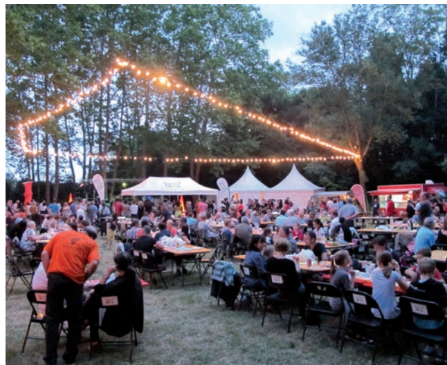
Les Soirées festives de Bocaud, vendredi 27 et samedi 28 juin 2014