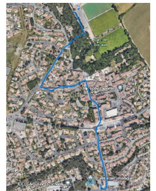
Parcours de la roussataïo

*La roussataïo consiste en un lâcher de juments suitées (avec leurs poulains de l'année non sevrés) dans les rues de la ville, escortées par les cavaliers de la Manade.